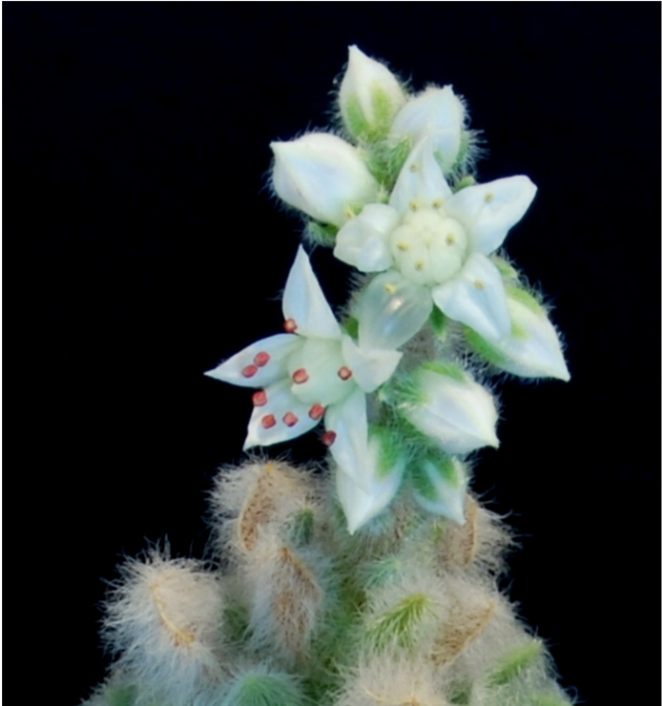
Et à la troisième place : MrKabuto Astrophytum asterias cv super kabuto :